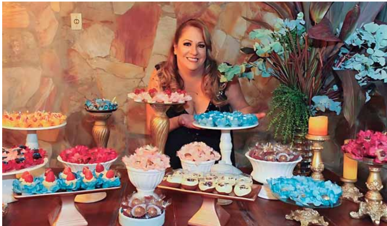
A história da Claudine Leite Chocolates nasceu do desejo de criar doces que proporcionassem prazer, alegria e memórias inesquecíveis, unindo sua paixão por sabores sofisticados ao talento transformado em negócio.

Embora ainda não haja planos para lojas físicas, a Claudine Leite Chocolates está investindo for-